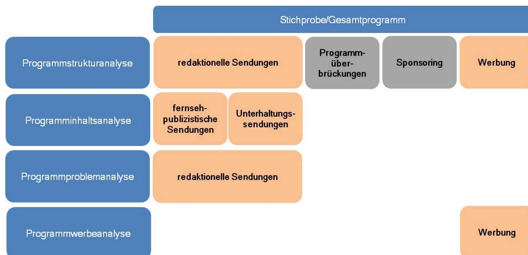
Abbildung 1: Analysekonzept

Die Teilanalysen beziehen sich auf unterschiedliche Ebenen: Die Programmstrukturanalyse erfolgt auf Basis der analysierten Sendungen (erste Ebene), alle weiteren Teilanalysen erfolgen auf Ebene der einzelnen Programmelemente bzw. Beiträge (zweite Ebene). Die Analysen der zweiten Ebene berücksichtigen ausschließlich solche Beiträge, bei denen eine weitere inhaltliche Analyse