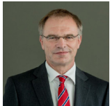
Stefan Raue Intendant des Deutschlandradio